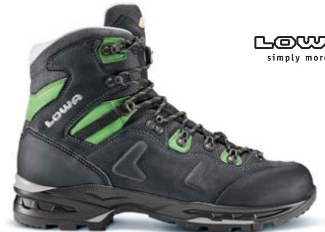
LOWA simply more...