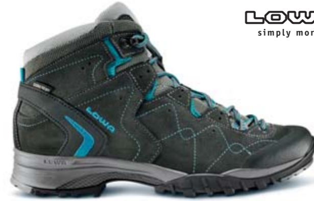
LOWA simply more...