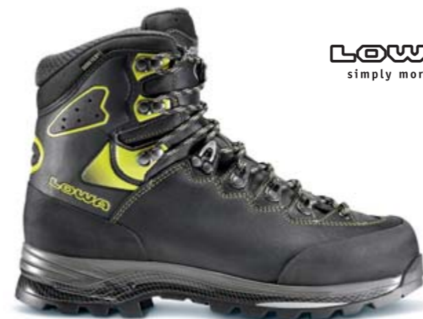
LOWA simply more...