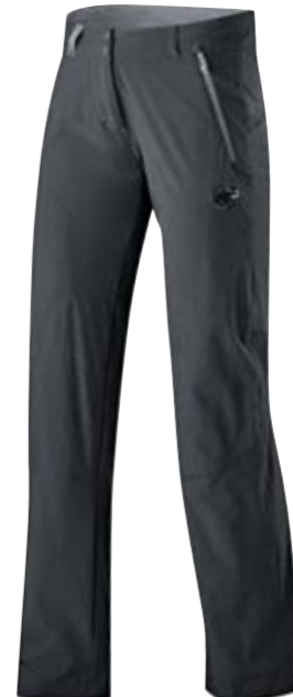
RUNJE PANT WOMEN Aus robustem, abriebfestem Nylonmaterial. Hosenbeine mit Krepelsystem. Praktische Taschen (z.B. für Wanderkarte). CHF 150.-