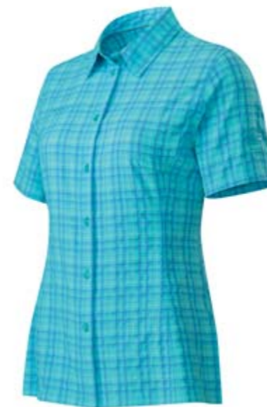
ALESSANDRIA SHIRT WOMEN Leichte, schnelltrocknende Bluse für Wandern, Reisen und Freizeit. CHF 90.- DrykeepMC®