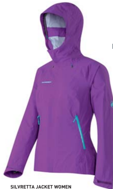
SILVRETTA JACKET WOMEN Ideal für eintägige Touren oder Bergwanderungen. Extrem leicht (288 Gramm), atmungsaktiv und klein packbar. Gore-Tex®-Active bietet zuverlässigen Wind- und Regenschutz. CHF 380.-