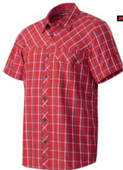
ASKO SHIRT MEN Funktionshemd aus leichtem Sommerstoff. UV-Schutz 30+. CHF 80.-