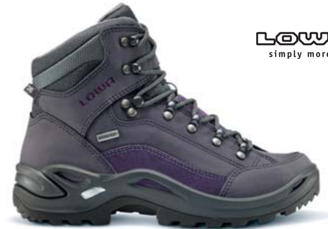
LOWA simply more...