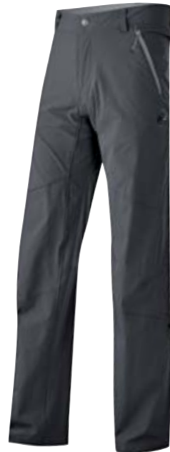
RUNBOLD PANT MEN Aus robustem, abriebfestem Nylonmaterial. Hosenbeine mit Krepelsystem. Praktische Taschen (z.B. für Wanderkarte). CHF 150.-